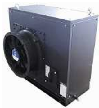
室内機 風量 5,000\text{m}^3/\text{h} 全静圧 229\text{Pa}