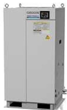
室外機 (10 馬力) 冷却却能 24kW