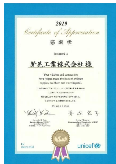
日本ユニセフ協会 感謝状